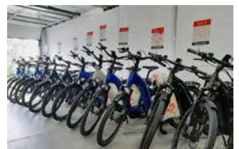
FLYER Outlet Teufen